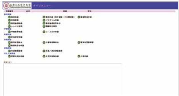
■メインメニュー画面